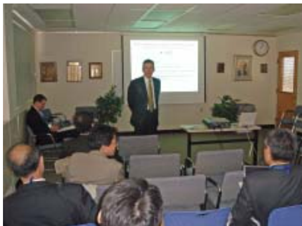
写真1 開会の辞を述べる Sadoway 教授