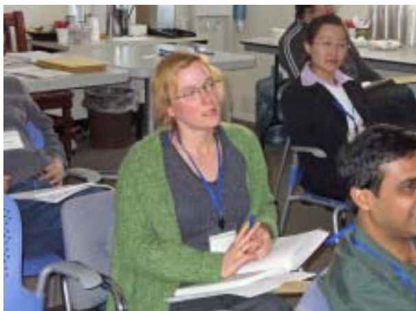
写真3 講演を聴講する参加者