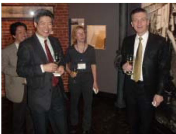
写真5 MIT Museum にて開催されたバンケットの一コマ