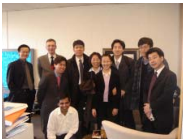
写真 6 MIT のラボツアーおよびキャンパスツアーを終えて